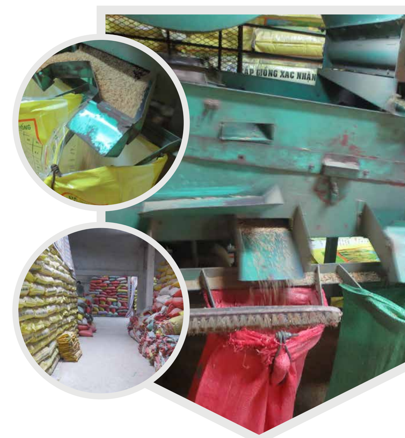
Décorticage des récoltes, conditionnement et stockage Riz (Vietnam)