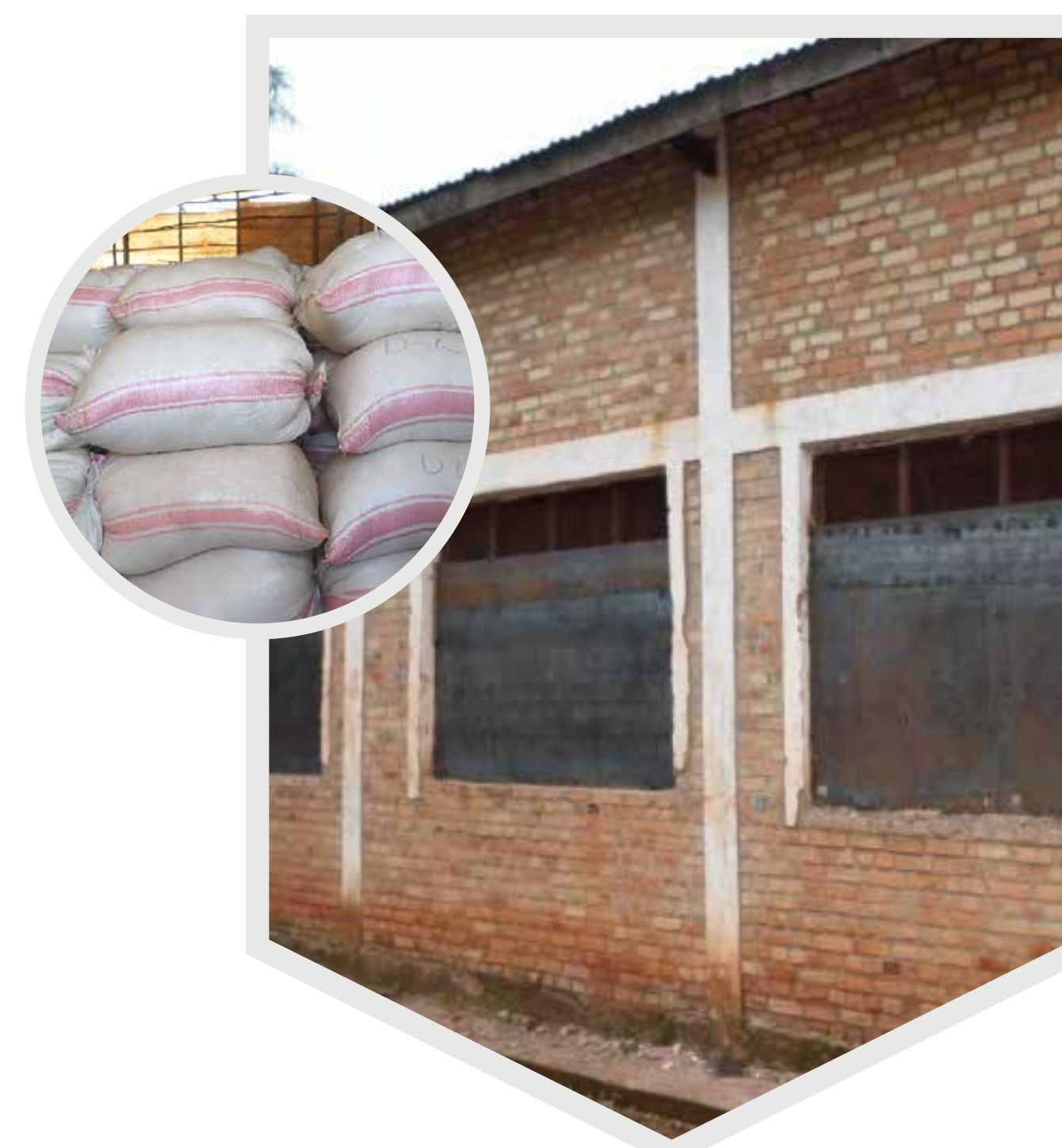
Stockage des récoltes en sacs hermétiques entreposés dans des hangars de stockage fermés Riz (Burundi)