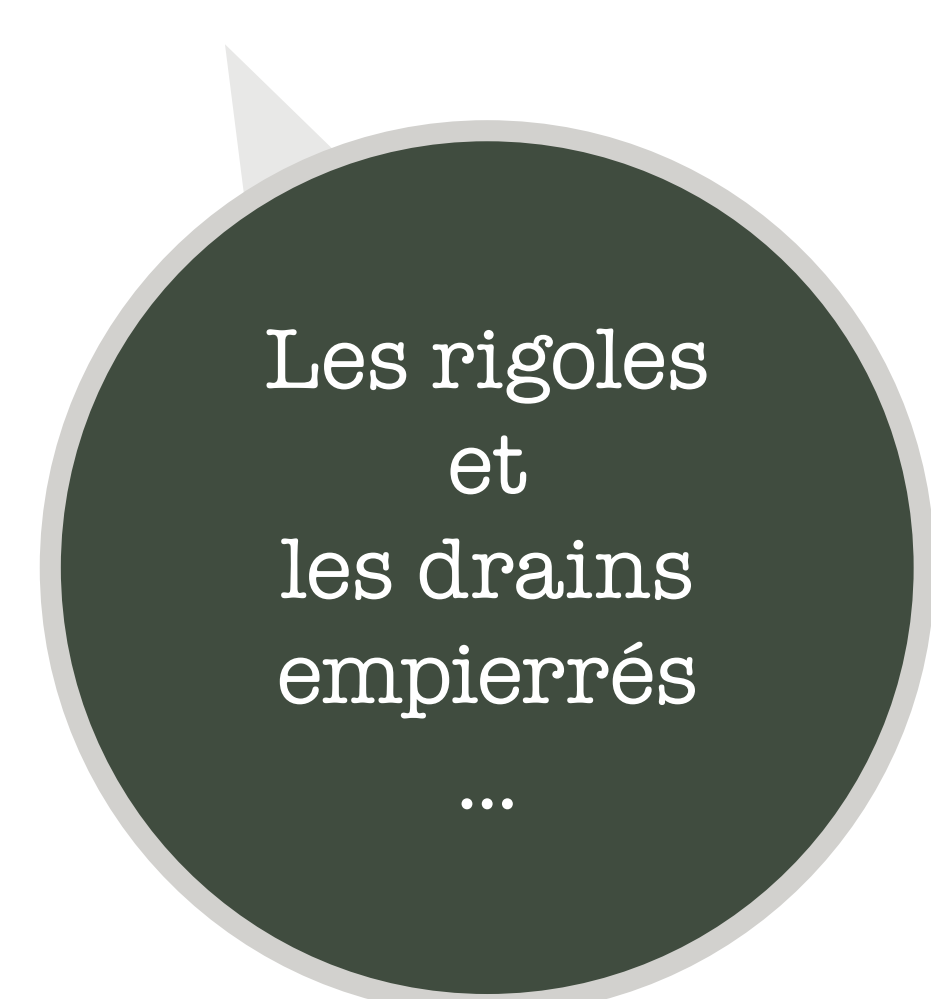
Les rigoles et les drains empierrés ...

... permettent la rétention de l'eau et du sol par des arbres et herbes fixatrices.