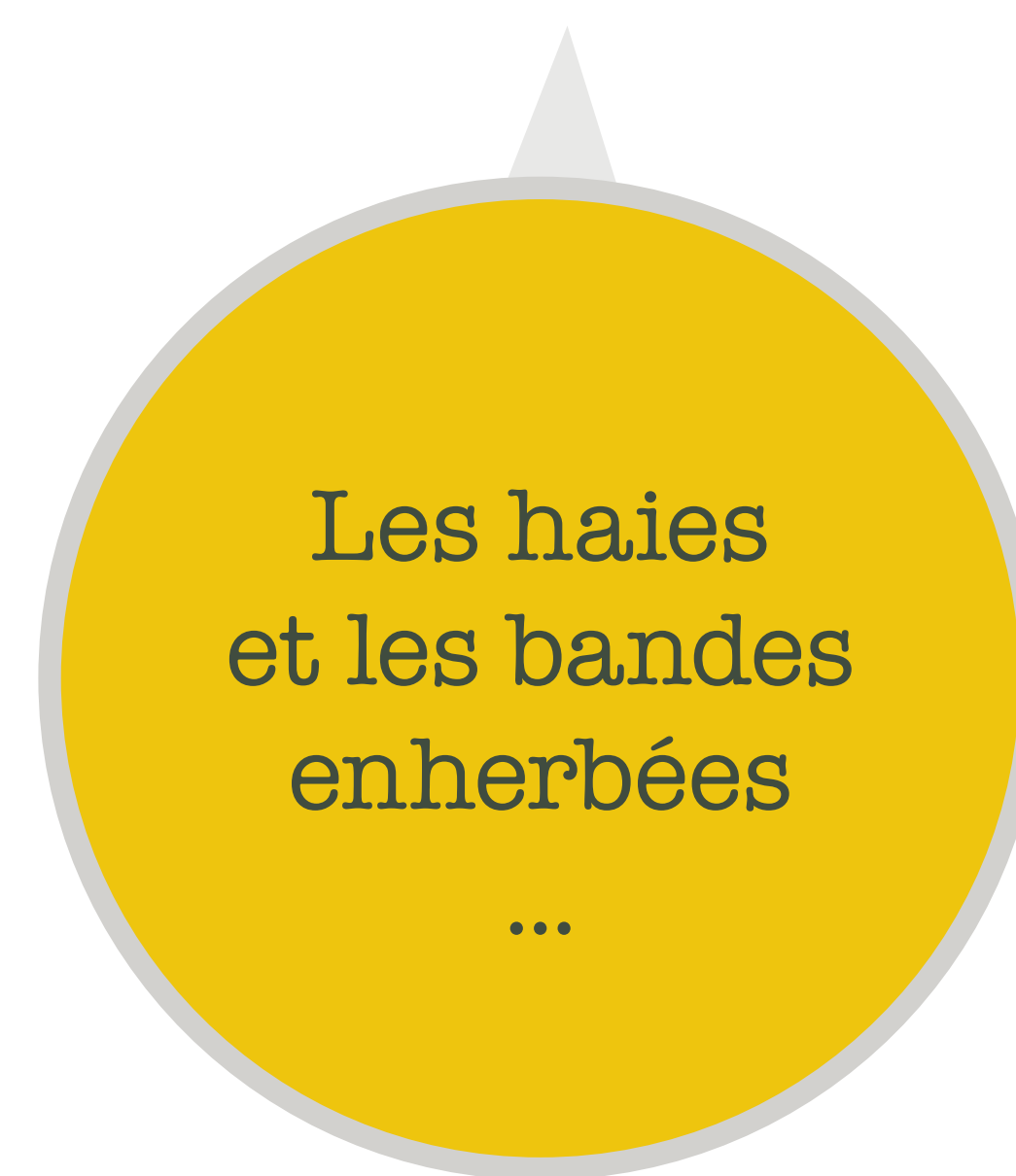
Les haies et les bandes enherbées ...

De nombreuses techniques antiérosives sont mises en oeuvre.