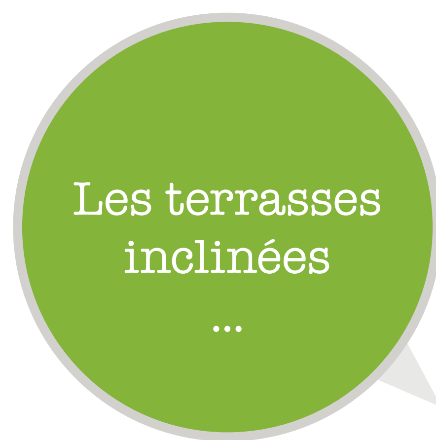
Les terrasses inclinées ...