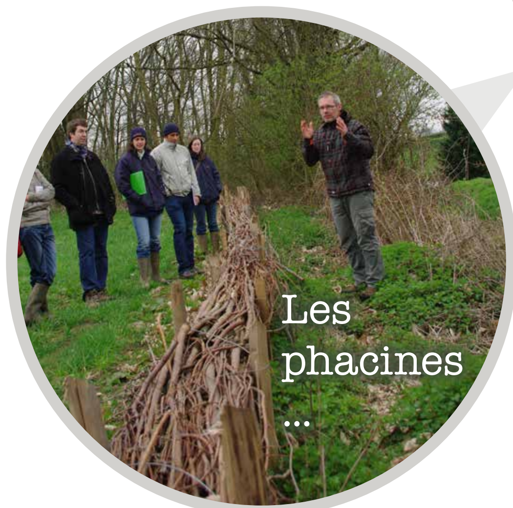
Les phacelles ...

Certaines régions subissent des inondations dues aux fortes pluies . Les agriculteurs sont souvent montrés du doigt et pourtant, ils mettent en place des moyens pour vous préserver de ces coulées de boues.