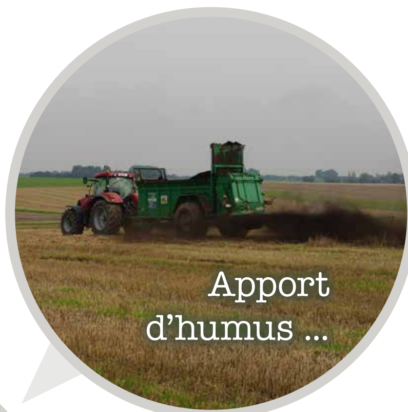
Apport d'humus ...

... permet de préserver la structure des sols.