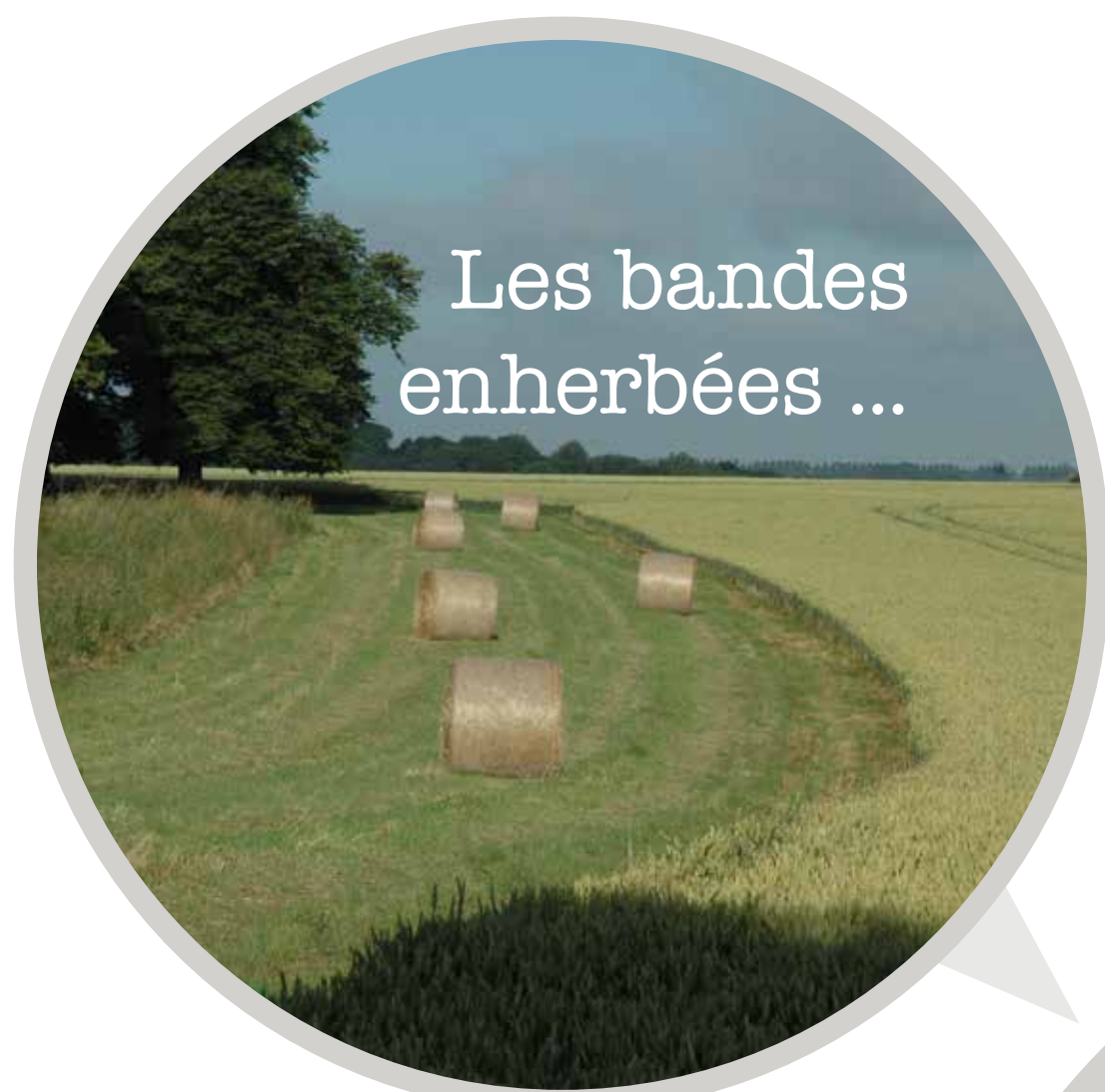
Les bandes enherbées ...