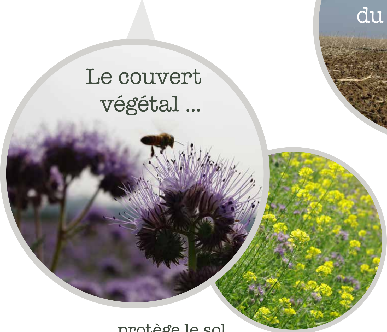
Le couvert végétal ...

... permet de garder la matière organique en surface.