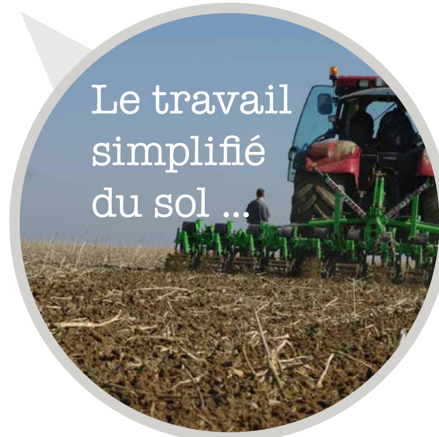
Le travail simplifié du sol ...

... jouent un rôle de filtre, retiennent les boues et laissent passer l'eau